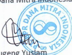
Sugeng Yuslam Direktur Utama